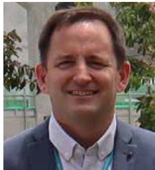
Werdecker-Davies Owen Kirchberg/Mattighofen